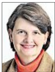
Kritik an Röttgen: Die Umweltpolitiker Flachsbarth und Sander.

Sander kritisierte, dass der atomare Müll durch die gesamte Republik nach Niedersachsen gefahren werde. Dabei sei die Entsorgung des Atommülls eine gesamtstaatliche Aufgabe. Leider habe Bundesumweltminister Norbert Röttgen (CDU) noch immer keinen Entwurf zu einem Endlagergesetz vorgelegt.