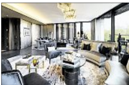
Hyde Park Number One – ein Appartement kostet 5,9 Millionen Pfund. dpa

Ein Zeichen für die Wanderungsbewegungen der Wohlhabendsten sind aller-